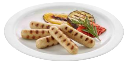
1010590 VEGETARISCHE CIPOLLATA auf Basis von Eiweiss, Tofu und Weizenproteinen ca. 25 g gewürzt 3 x 1 kg/Karton Zustand: durchgegart 🌐 Herkunft: CH