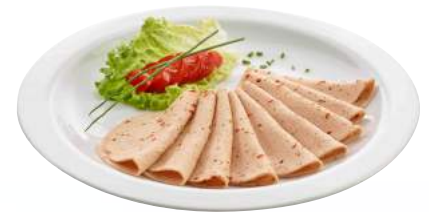
1010592 VEGETARISCHER AUFSCHNITT MIT PEPPERONI auf Basis von Eiweiss, Weizen- und Milchproteinen ca. 250 g gewürzt 18 x 0.25 kg/Karton Zustand: durchgegart 🌐 Herkunft: CH