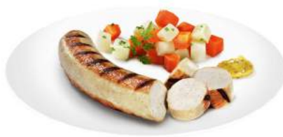
1010589 VEGETARISCHE BRATWURST MIT GRILLSTREIFEN auf Basis von Eiweiss, Tofu und Weizenproteinen ca. 100 g gewürzt 3 x 1 kg/Karton Zustand: durchgegart 🌐 Herkunft: CH