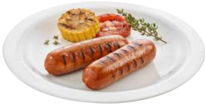
1009417 VEGETARISCHE CERVELAT auf Basis von Eiweiss, Tofu und Weizenproteinen ca. 80 g gewürzt 5 x 1 kg/Karton Zustand: durchgegart 🌐 Herkunft: CH