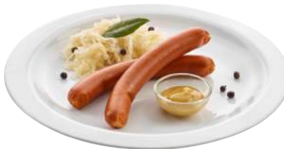
1010591 VEGETARISCHES WIENERLI auf Basis von Eiweiss, Weizen- und Molkenproteinen ca. 50 g gewürzt 3 x 1 kg/Karton Zustand: durchgegart 🌐 Herkunft: CH